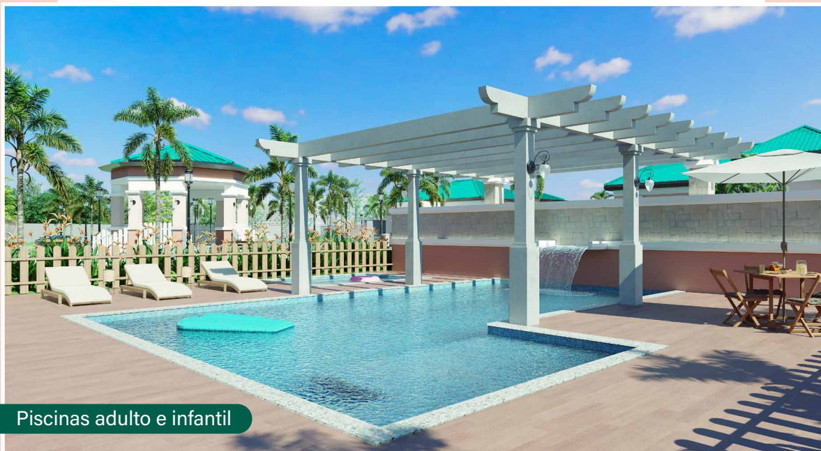
Piscinas adulto e infantil