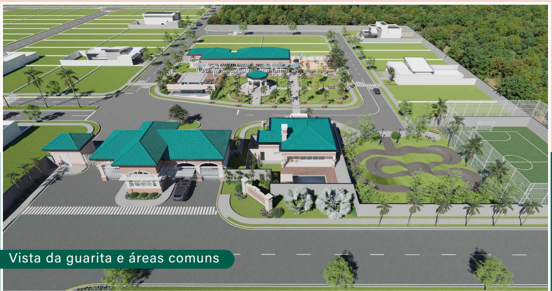
Vista da guarita e áreas comuns

A qualidade de vida que você merece , nas condições que combinam com você!