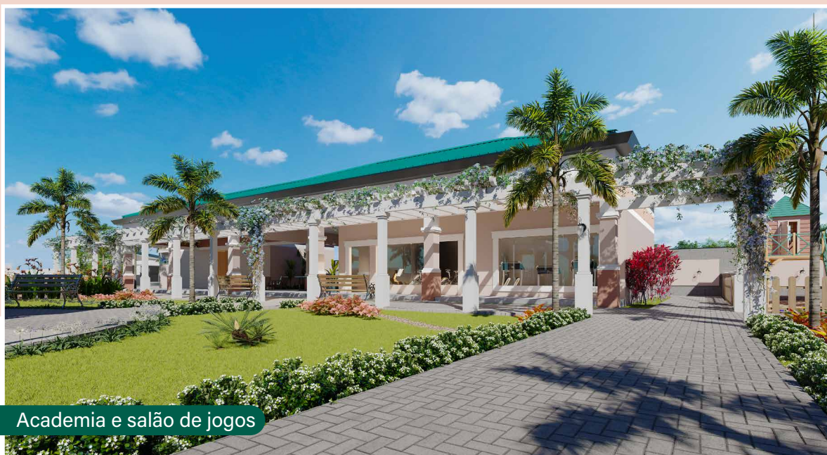
Academia e salão de jogos